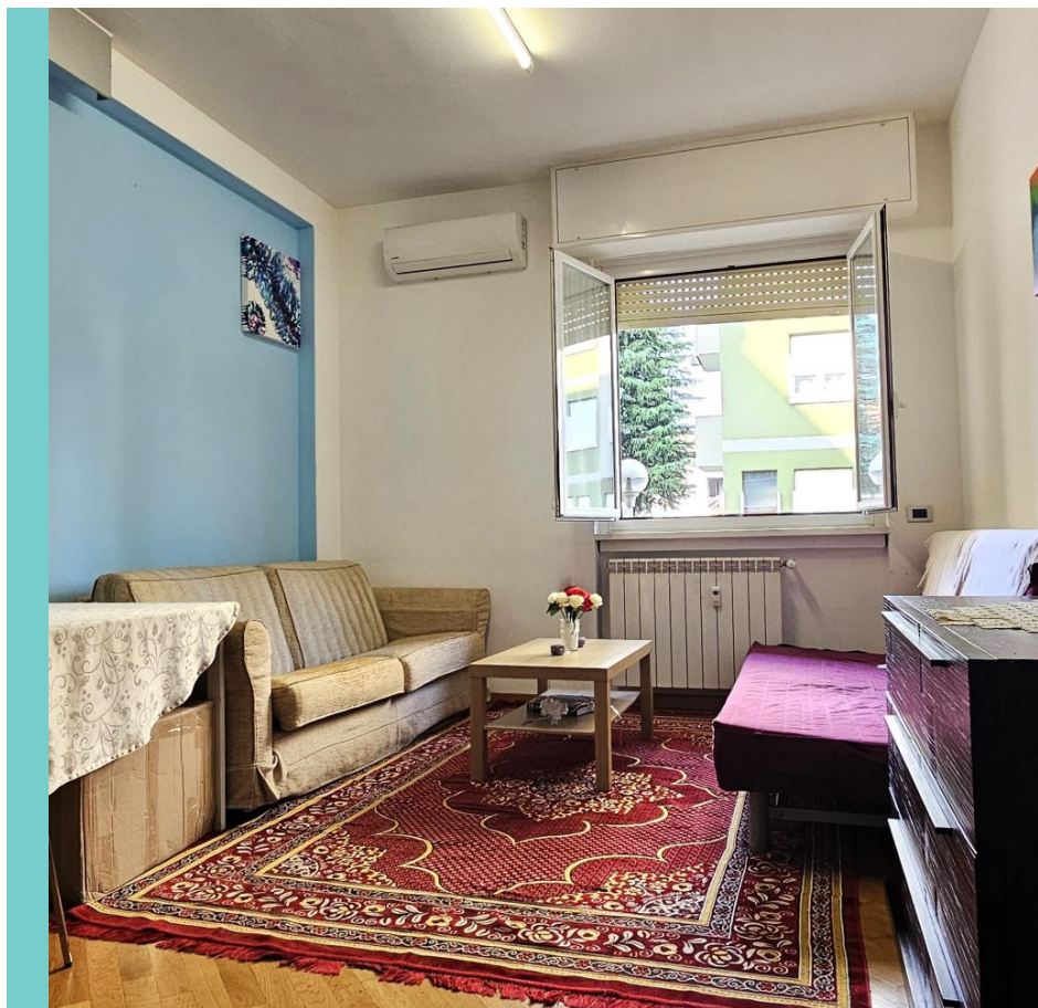
La proprietà dispone di 1 camera Superficie 66 mq